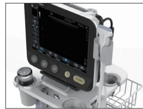
超音波装置(エコー)

「首のしこり(甲状腺)」甲状腺や頸部疾患の診療経験を生かし、首の腫れやしこりに対する専門的な診療を行います。当院では超音波装置(エコー)を導入しており、正確な診断と経過観察に役立ちます。